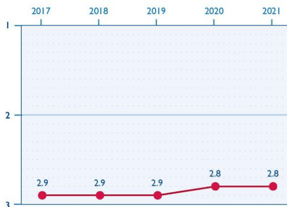
SEKTORIAUS INFRASTRUKTŪRA LIETUVOJE

Pandemijos metu išaugusi tarpsektorinė partnerystė išliko stipri sprendžiant nelegalios migracijos iššūkį. Reaguodamos į Baltarusijos valdžios organizuojamą didelio masto neteisėtą migraciją, PVO ir verslo įmonės susibūrė palaikyti Lietuvos pasienio policijos. Nepriklausomas žiniasklaidos kanalas „Freedom TV“ pradėjo lėšų rinkimo kampaniją „Laikykitės, pasieniečiai!“, kuri buvo skirta pareigūnų, sprendžiančių krizę Baltarusijos ir Lietuvos pasienyje, darbo atlygio priedams. Sukarinta visuomeninė organizacija Lietuvos šaulių sąjunga telkė savanorius stebėti neapsaugotas pasienio vietas, o Maisto bankas, Raudonasis kryžius ir kitos PVO teikė humanitarinę pagalbą migrantams.