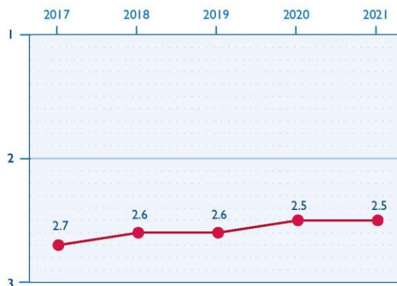
ORGANIZACINIAI PAJĖGUMAI LIETUVOJE

Daugelis PVO ir toliau veikia be valdybų. Mažąsias PVO, steigiamas pagal Viešųjų įstaigų įstatymą (viešojo įstaiga), dažnai steigia ir joms vadovauja tas pats asmuo. Asociacijos privalo turėti valdymo organus, tačiau pandemijos metu jie posėdžiavo rečiau. Visuotiniai susirinkimai vėlavo, o tai turėjo įtakos valdybų rotacijai ir atsiskaitymui valstybei. Nors kai kurių asociacijų nariai atsisakė dalyvauti internetu rengiamuose visuotiniuose susirinkimuose, daugelis šių organizacijų pasinaudojo tarp pandemijos bangų atsiradusia galimybe surengti susirinkimus gyvai.